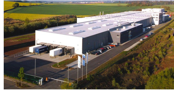
BWF Protec Hof – Gattendorf

Die BWF Group. Regional verwurzelt, weltweit führend.