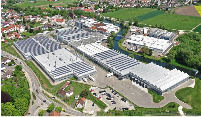
BWF Group Offingen

Die BWF Group ist eine in der fünften Generation inhabergeführte Unternehmensgruppe mit Hauptsitz in Offingen, Bayern. Mit 1.800 Mitarbeitern an weltweit 16 Produktionsstandorten setzen wir international Maßstäbe durch Innovation, Kompetenz